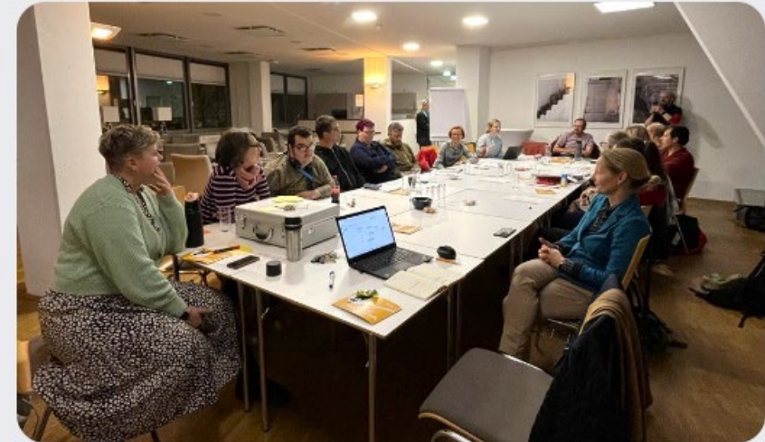
Netzwerk-Treffen in der Volkshochschule Dresden.

Hier erfahren Sie alles über das Netzwerk inklusive politische Bildung. Lernen Sie uns und unsere Projekte kennen.