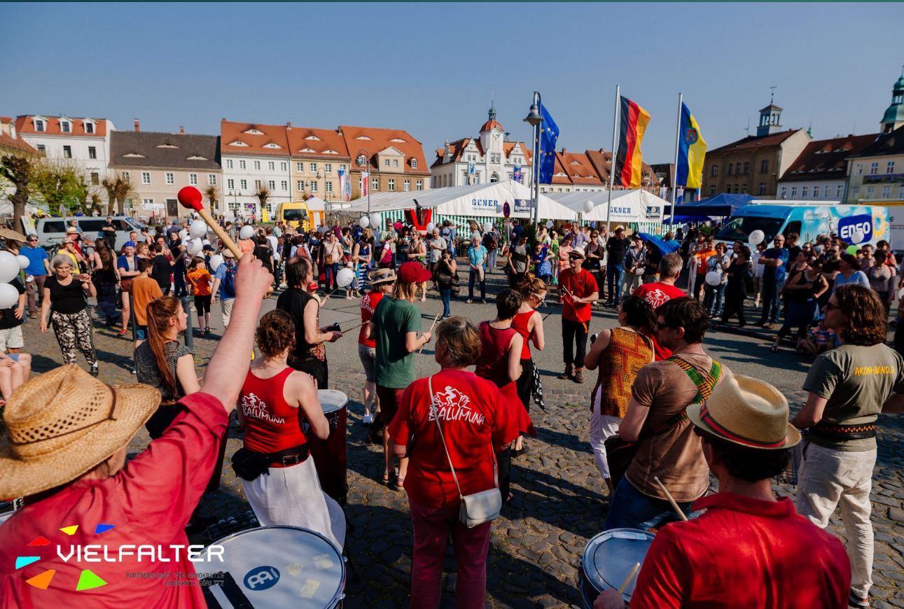
Ostritzer Friedensfest 2018 – Gegenveranstaltung zum Schwert- und Schild (SS)-Festival