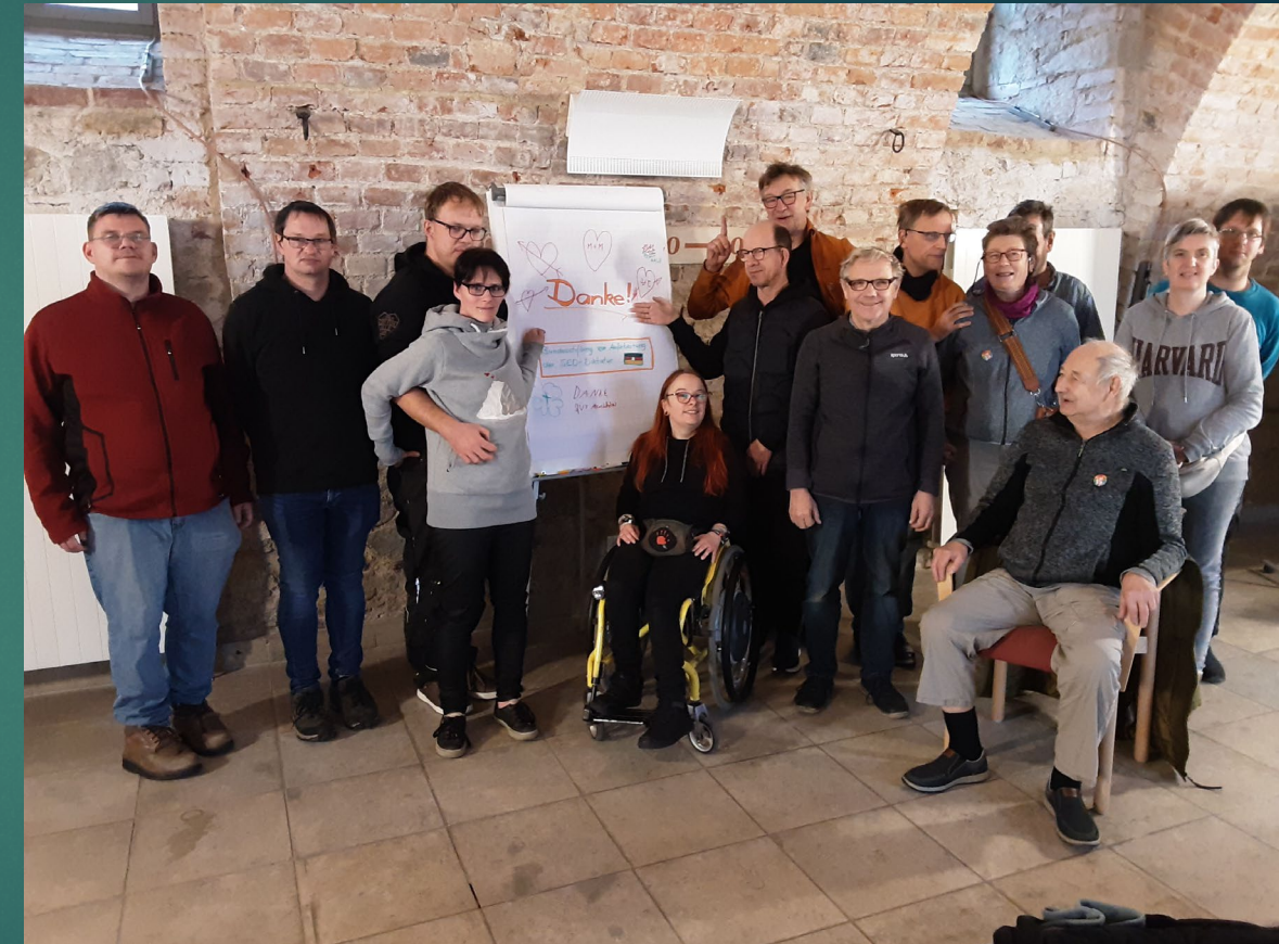
Zeit.Zeichen! Veranstaltung 2025 zum 17. Juni 1953 Polit. Bildung für Menschen mit kognitiven Beeinträchtigungen